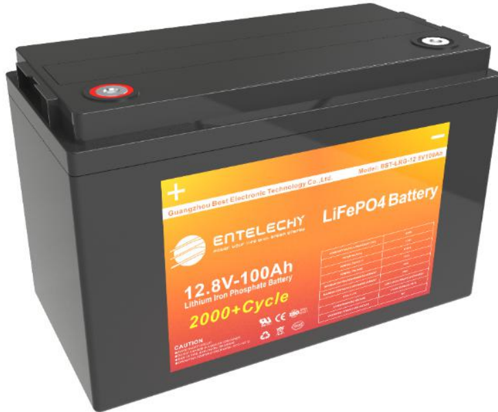
12V100Ah电池外形图示（仅供参考，具体以实物为准）