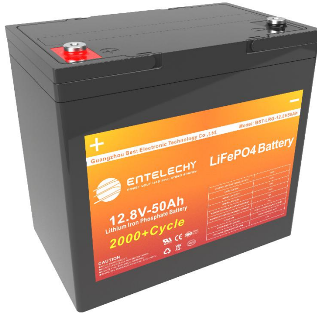
12V50Ah 电池外形图示（仅供参考，具体以实物为准）